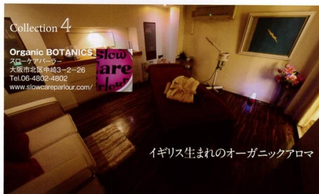
イギリス生まれのオーガニックアロマ